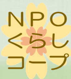
NPO 法人 くらしコープ