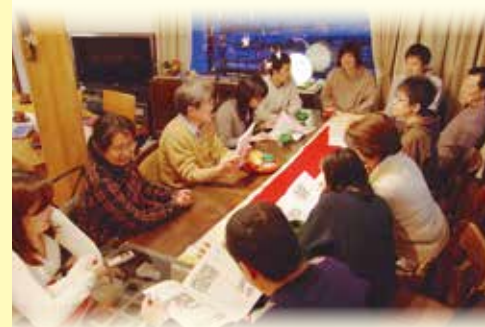
お茶会・交流会のようす