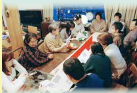
お茶会・交流会のようす